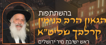
בהשתתפות הגאון הרב בנימין פינקל שליט"א ראש ישיבת מיר ירושלים

TORONTO SUNDAY EVENING ט"ז אייר תשפ"ג MAY 7, 2023 8:00 PM