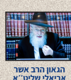
הגאון הרב אשר אריאלי שליט"א VIA VIDEO HOOKUP