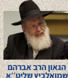
הגאון הרב אברהם שמואלביץ שליט"א